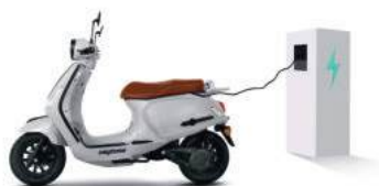
ΦΟΡΤΙΣΗ ΜΕ ΚΛΕΙΣΤΗ ΣΕΛΑ