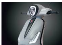
FULL LED LIGHTS