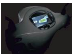
2 ΔΙΣΚΟΦΡΕΝΑ / CBS