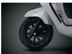
2 ΔΙΣΚΟΦΡΕΝΑ / CBS